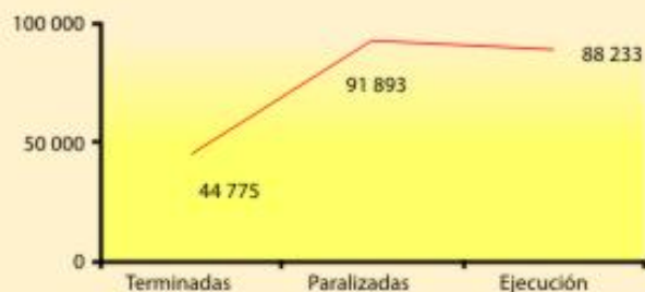
Viviendas terminadas por organismo constructor.