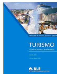
Llegada de visitantes enero-mayo en los últimos cinco años

Los visitantes que arriban en este mes, 183 791, representan un 7,2% más que en igual período del año 2010; 11,6% más que en el mismo mes de 2009 y un 15,7% que en 2008.