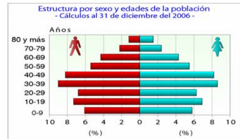
Otros indicadores, año 2006